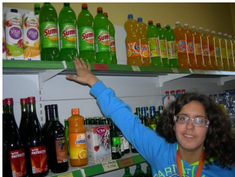
Sumo de ananás